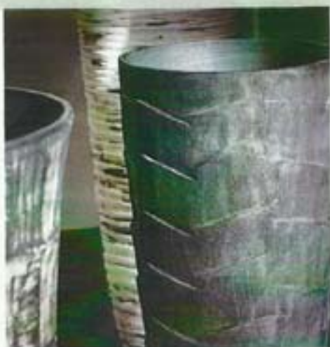
TEXTURAS: las piezas de cerámica de Carme Balada denotan que la naturaleza es una importante fuente de inspiración para la creadora barcelonesa.