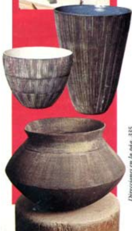
Direcciones en la foto: 335