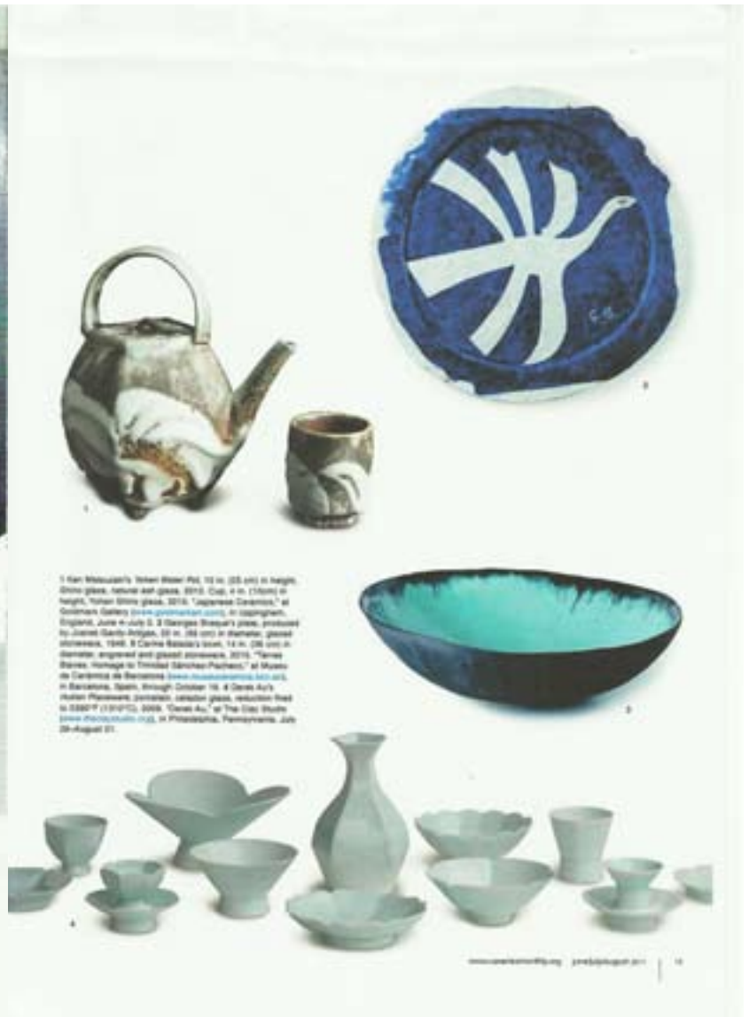
1 Han Mitsuaki's Tokon Bizen Pot, 13 in. (33 cm) in height, clear glass, natural ash glass, 2010. Cup, 4 in. (10 cm) in height, Tokon Bizen glass, 2010. "Japanese Ceramics," at Goldman Gallery www.goldmanart.com , in Longueville, England, June 4-July 2. 2 Giorgio Bonajuti's glass, produced by Gianni Gatti-Angeli, 10 in. (25 cm) in diameter, glassed aluminum, 1981. 3 Carme Salada's bowl, 12 in. (30 cm) in diameter, engraved and glassed porcelain, 2010. "Carme Salada. Homage to Trinidad Sánchez-Pacheco," at Museo de Cerámica de Barcelona www.museoceramica.cat , in Barcelona, Spain, through October 10. 4 Carme Salada's plates, porcelain, colored glass, reduction fired to 1300°C (2372°F), 2009. "Carme Salada," at The Clay Studio www.theclaystudio.com , in Philadelphia, Pennsylvania, July 28-August 21.

NUMERO: CARMÉ SALADA DEL ROMERO. CERAMISIA. SHOWROOM: FRERES DE BAJOS - 08002 BARCELONA CONTACTO: WWW.CARMEBALADA.COM